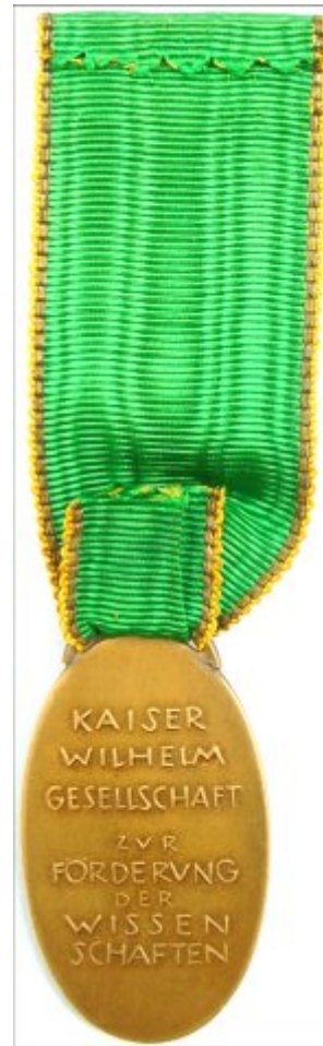
Revers der Medaille

Die hoch-ovale Bronzemedaille zeigt auf der schwach geränderten Vorderseite das stehende Abbild der römischen Minerva mit Schild und Speer.