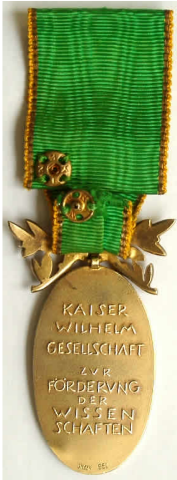
Revers der Medaille

Die randlose Rückseite trägt die achtzeilige Inschrift: