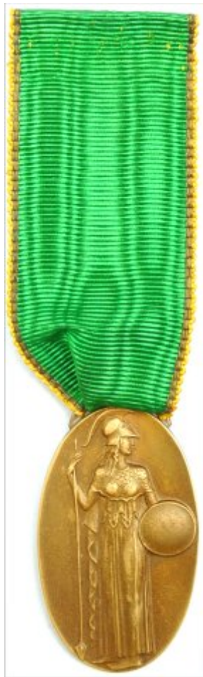
Avers der Medaille

Hergestellt wurden die Abzeichen von den Gebr. Hemmerle in München nach einem Entwurf des Direktors der staatlichen Kunstgewerbeschule München, dem Architekten Carl Sattler.