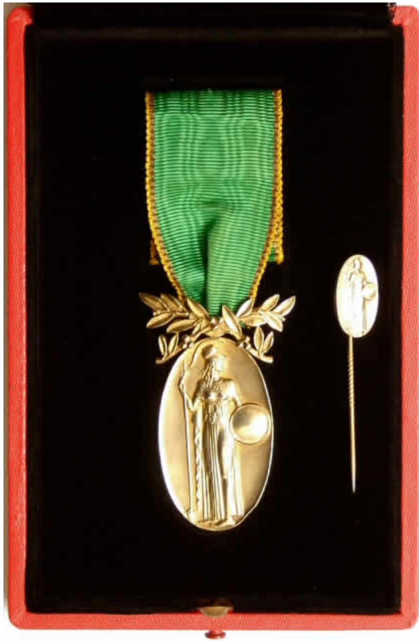
Das Mitgliederabzeichen im geöffneten Etui mit Miniatur

In der "ordenslosen" Weimarer Republik, in der nach Art. 109 der Weimarer Reichsverfassung staatliche Orden und Ehrenzeichen verboten waren, nahmen Auszeichnungen privater Natur ihre Stelle ein, für die dieses Verbot nicht galt.