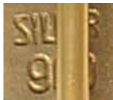
Silbermarken der Anstecknadel

Die silber-vergoldete Anstecknadel wurde von der Firma Deschler in München hergestellt. Maße: 18 x 11 mm, an 49 mm langer Nadel. Am unteren Rand der Anstecknadel befinden sich die Marken "SILBER" und "900".