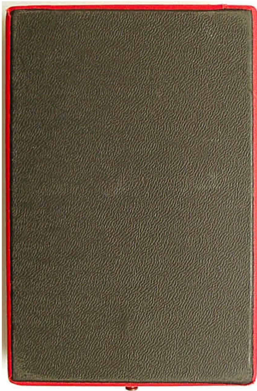
Etui Rückseite Maße: 144 x 95 x 26 mm

Die Unterseite des Etuis ist schwarzem, geprägtem Papier beklebt. Innen ist das Etui mit schwarzem Samt ausgeschlagen und besitzt eine Vertiefung für die Medaille und das Band.