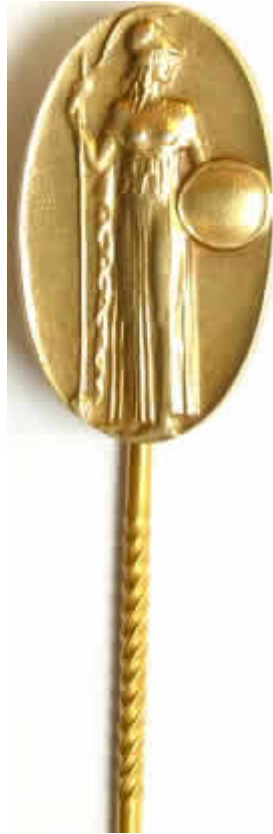
Miniatur als Anstecknadel

Die silber-vergoldete Anstecknadel wurde von der Firma Deschler in München hergestellt. Maße: 18 x 11 mm, an 49 mm langer Nadel. Am unteren Rand der Anstecknadel befinden sich die Marken "SILBER" und "900".