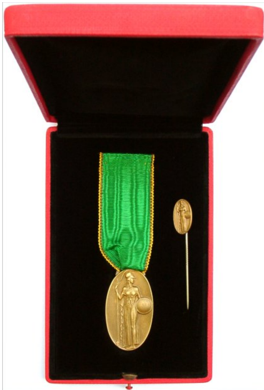
Das Verdienstabzeichen im geöffneten Etui mit Miniatur

Das Verdienstabzeichen der KWG wurde durch den Präsidenten an solche Persönlichkeiten verliehen, die der Gesellschaft als Beamte oder Angestellte angehören oder angehört haben und sich in mehrjähriger Tätigkeit besonders verdient gemacht haben. Sämtliche Abzeichen waren schon damals nicht im Handel erhältlich. Der für die Beschaffung der Abzeichen beauftragte Professor der Kunstgewerbeschule München, Friedrich Schmidt, hielt die Stanzen zur Herstellung der Abzeichen, bis auf den kurzen Moment der Herstellung, immer unter Verschluss. Die Amtskette sowie Abzeichen zu 2 bis 4 verblieben im Eigentum der Gesellschaft und waren nach dem Erlöschen derselben rückgabepflichtig. Das erklärt auch ihre heutige Seltenheit. Getragen wurde das Abzeichen im linken Knopfloch.