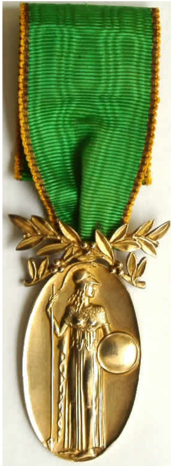
Avers der Medaille

Die hoch-ovale, silber-vergoldete Medaille zeigt auf der schwach geränderten Vorderseite das stehende Abbild der römischen Minerva mit Schild und Speer. Die Medaille wird von zwei Lorbeerzweigen überhöht, die beweglich angebracht sind.